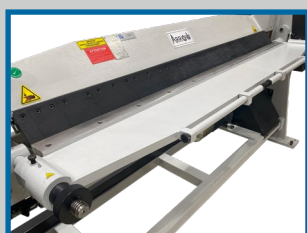
Tablier en position pliage