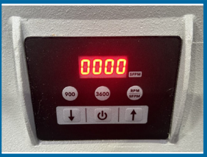
Variateur de vitesses de rotation