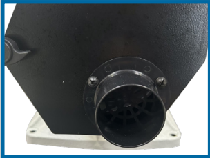
Sortie pour aspiration des copeaux