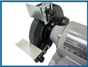
Meule + support amovible