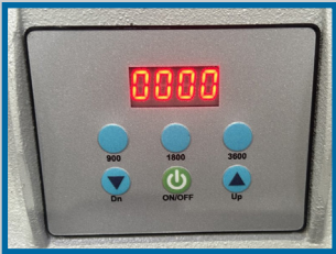
Variateur de vitesses de rotation