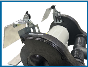
Plexiglass de protection