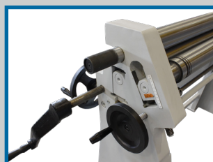
Volant de montée/baisse du rouleau arrière