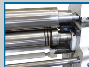
3 gorges en extrémité