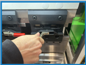
Attachement outillage serrage rapide 1/4 de tour