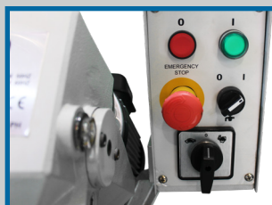
Boîtier de commande