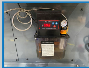
Centrale de graissage automatique