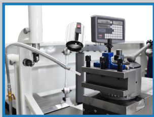
Tourelle à changement rapide