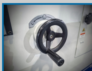
Manivelle d'ajustement de la tension du ruban