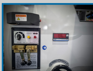
Dispositif de soudure de la lame