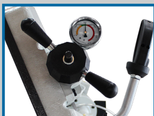
Manivelle avec manomètre