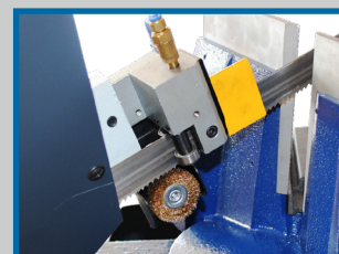
Patins carbure guide lame et brosse