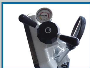
Manivelle avec manomètre de tension de la lame