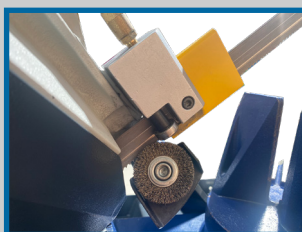
Patins carbure guide lame