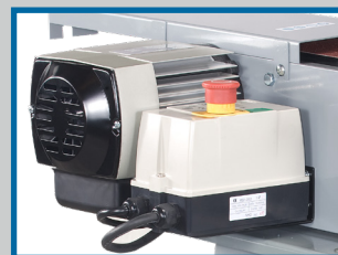
Moteur puissant 750W