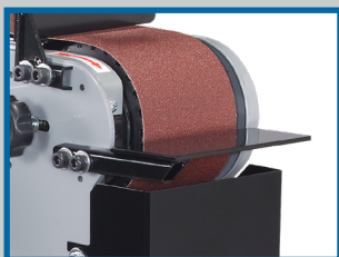
Zone de meulage de chant