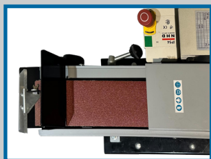
Zone de meulage horizontale