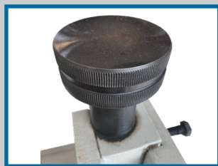
Molette de réglage de l'épaisseur