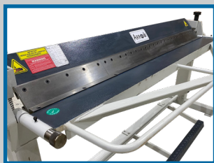
Tablier en position pliage