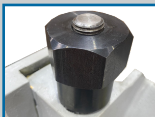
Molette de réglage de l'épaisseur