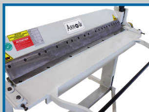
Tablier en position pliage