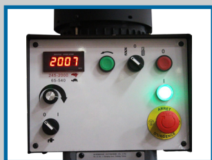
Pupitre de commande