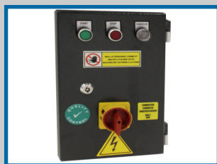
Boutons de commande