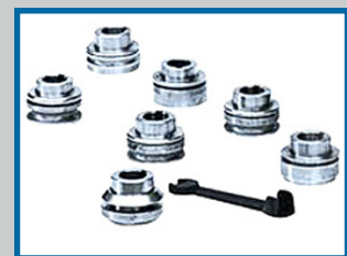
Jeu de molettes + clé