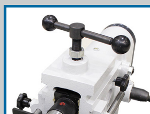
Réglage du galet supérieur