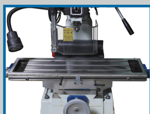
Table de travail