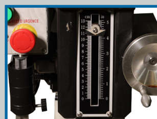
Jauge de profondeur