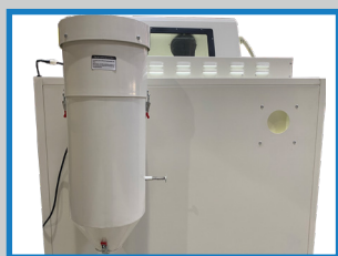
Filtre décolmatant manuel